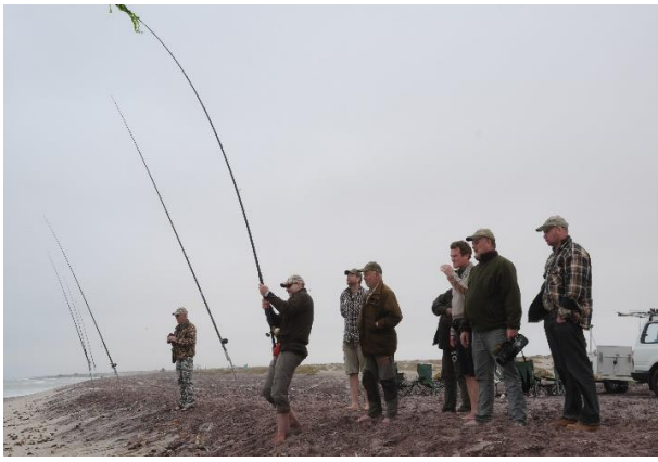
Etter jakten velger mange å prøve hai fiske!