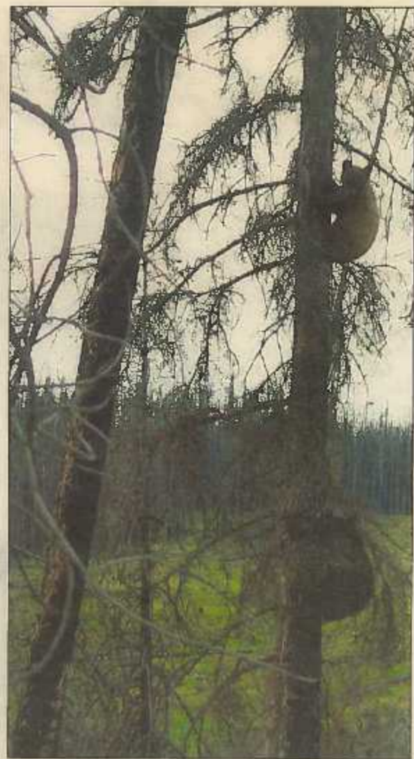
OPPLEVING FOR LIVET. Her er to av dei rundt seks ti bjørnane dei såg på ei veka.