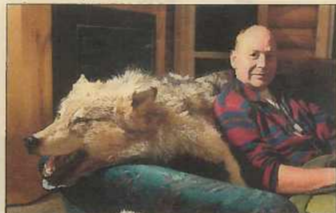
EKSKLUSIVT. Sofaryggen var kledd med ulveskinn. Alt på staden var bokstaveleg laga vilt.