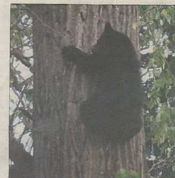
GOD KLATRAR: Ein liten svartbjørn, om lag to og eit halvt år, tekk dei «skote» med fotoapparatet.